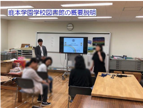
鹿本学園学校図書館の概要説明

最初は、鹿本学園学校図書館の概要について司書教諭からお話させていただきました。本を手に取りやすい環境を作り続けることが児童・生徒に本を手にとってもらう第一歩であることなど、そのためには教職員だけではなく図書館アテンダントの皆様の御協力のもとにあることなどをお話させていただきました。