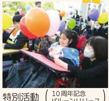
特別活動 (10周年記念 パレオンリリース)