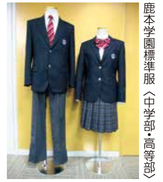
鹿本学園標準服(中学部・高等部)