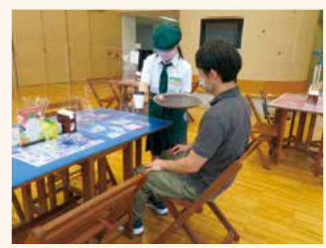
作業学習(カフェ班)