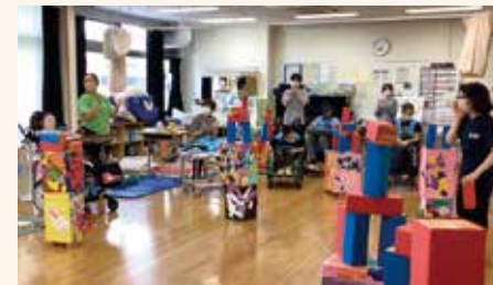
特別活動 (学年の時間)